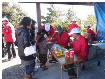
受付で参加賞を配布

富双緑地は青空が広がり、絶好の凧揚げ日和になりました。青空に数本の連凧が舞いました。凧揚げの後はあたたかい豚汁が配られ、200食分の豚汁は早めに“売切れ”となりました。