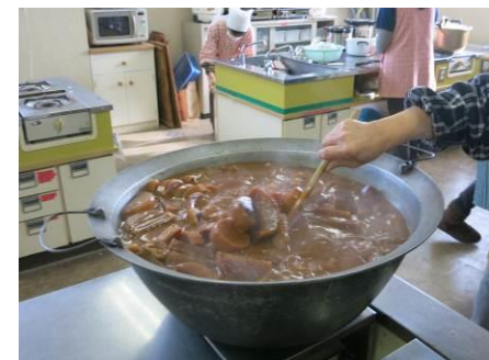
大きな大根が入った報恩講汁