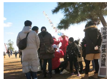
自分の凧はもう揚がったかな？

富双緑地は青空が広がり、絶好の凧揚げ日和になりました。青空に数本の連凧が舞いました。凧揚げの後はあたたかい豚汁が配られ、200食分の豚汁は早めに“売切れ”となりました。