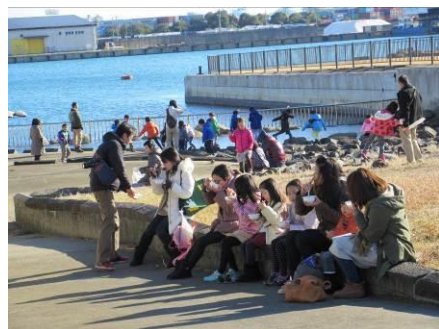
親子で豚汁を賞味