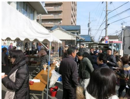
センター前の賑わい