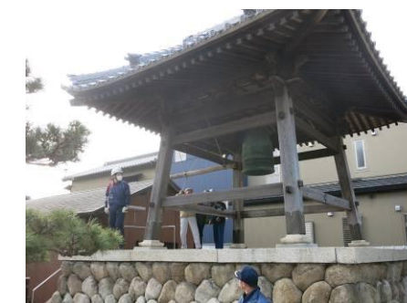
寺の鐘を打ち鳴らし周知する「早鐘」