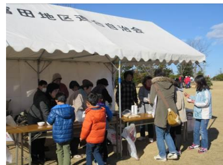
お茶と豚汁の給仕