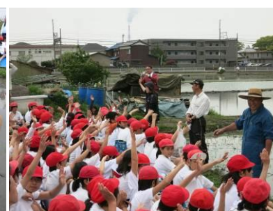
楽しかったひと手をあげて!