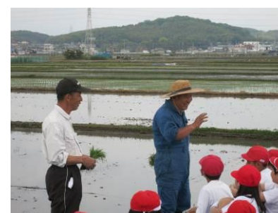
「稲は4カ月で収穫できます」先生も田植えに参加