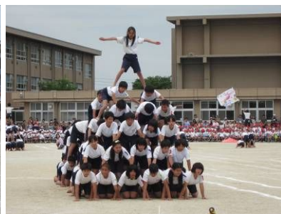
見事な大ピラミッド