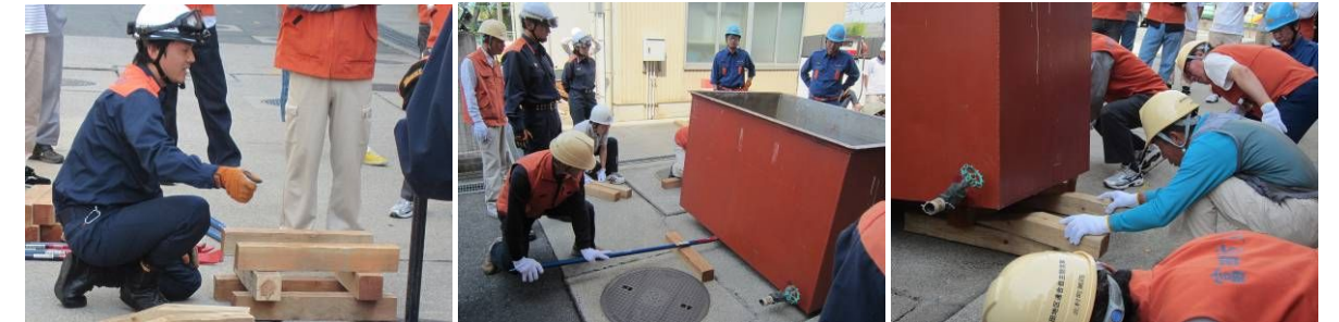
角材の組み方 バールは握らない 重量物の下に手を入れない

消防署員からは、バールを握らない(バールが外れて手を地面との間に挟む恐れから)、材木を入れる人の後ろの空間は空けておく(逃げ場の確保)、重量物の下に手を入れない、などの注意がありました。また救助後、圧迫症候群(クラッシュ症候群)で心不全に至る恐れがあるので大量の水分補給や圧迫箇所付近をタオルでしぼるなどの対策を話されました。