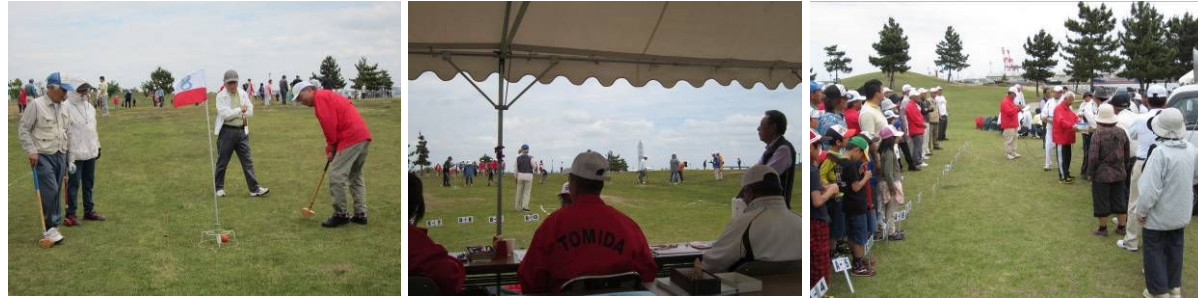
自治会長さんも競技参加 体育委員会の運営協力 表彰式で飛び賞授与 競技の結果(大人96名・子ども21名参加) 敬称略