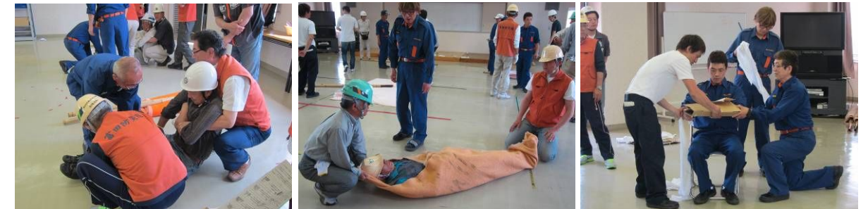
後ろから抱え、両手で左手を握る 毛布で包めば一人でも搬送可能 ダンボールで副木

防災教育センターで主に消防団員が講師になり搬送法・応急手当の研修が行なわれました。要救助者を道具なしで搬送する方法や、毛布を使った搬送法、竹と毛布を組み合わせ、担架を作る方法など実技を行い習得しました。また応急手当ではダンボールを副木とする固定法を学びました。“救助される人の気持ちになって”とのアドバイスがありました。