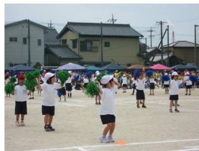
かわいい1年生のお遊戯(表現)