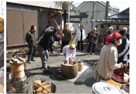
センター前でお餅つき