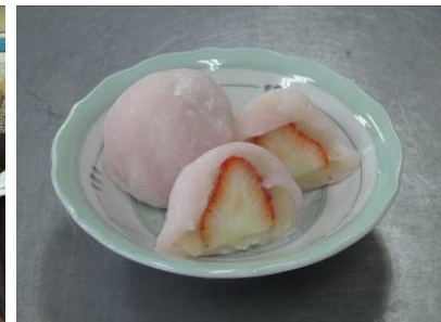
いちご大福の出来上がり