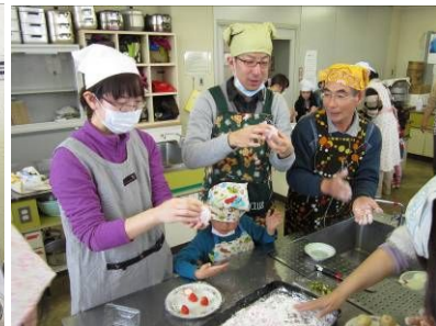
餅でいちご入りの餡を包みます