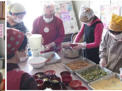
地域の方のお手伝い