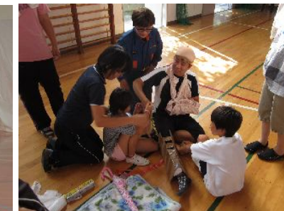
ダンボールで添え木