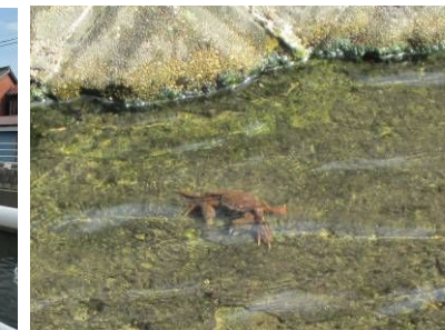
澄んだ水の中にカワガニ