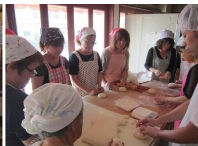
生地簡単な丸め方を指導