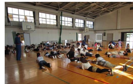
ストップ、ドロップ&ロール

富田小学校 PTA 主催の「子どもの未来を語る会」が体育館で行われ、消防分団が訓練指導に招かれました。体育館には教師とPTA、児童が集まり、訓練に参加しました。参加者は白い煙が充満した部屋の中を手探りで進む煙体験、体に火がついたときの動作、「ストップ(止まって)ドロップ(倒れて)&ロール(転がって)！」や、日常品を使った応急処置方法等について学びました。