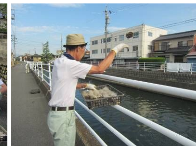
豊栄橋付近でEM だんごを投入