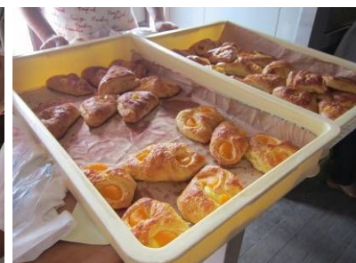
デニッシュの焼き上がり