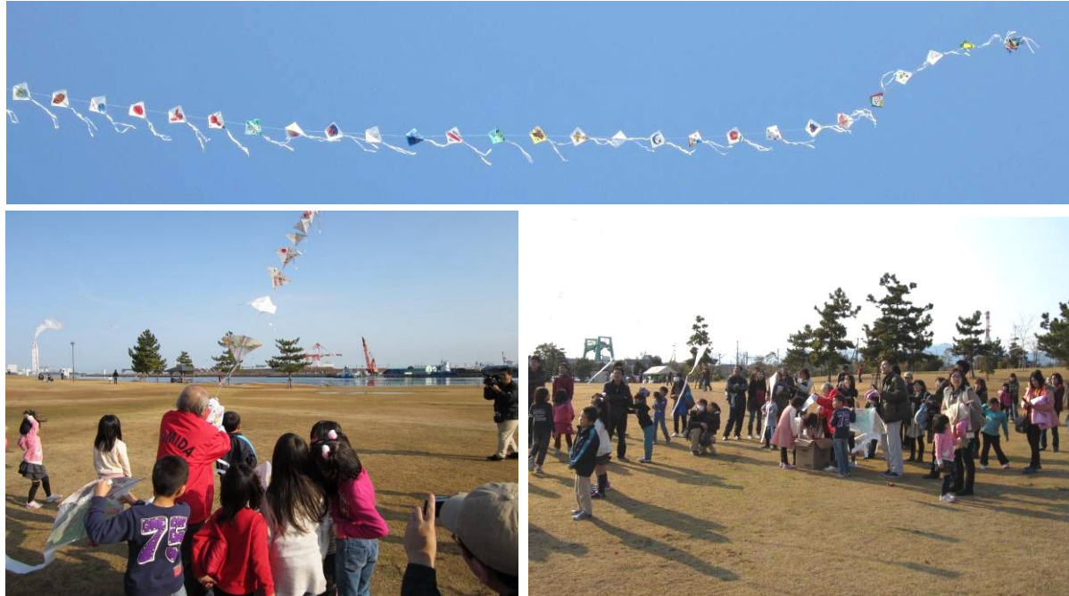
今年の1年生119人の連凧と見守る親子

開会時刻を過ぎても風がなくやきもきしましたが、2時過ぎから風が吹き始め、凧が揚がり始めました。富田小学校の歴代1年生の絵が描かれている連凧が、自治会長さんたちにより徐々に繰り出され、揚がり始めると、見守っていた小学生は飛び上がって喜びました。